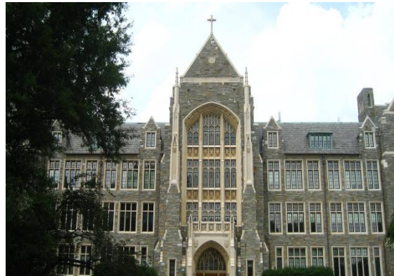
Georgetown University, Washington D.C.

Das Abschlussmodul 8 findet an der Georgetown University in Washington D.C. statt und steht unter dem Thema "Competing Globally in Public Health". Dieses Modul bietet den TeilnehmerInnen eine Einführung in Public Health. Es setzt das US-politische-System in einen global normativen Kontext. Verschiedene Politik-Strategien werden auf der bundesstaatlichen und föderalen Ebene diskutiert und anschließend in einen globalen Rahmen gesetzt.