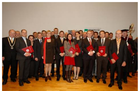
MBA Masterfeier an der Universität Salzburg, Juni 2009

Die Beurteilung der Master's Thesis und die Abhaltung der Prüfung über die Master's Thesis erfolgt durch die Lehrgangsleitung oder eine von der Lehrgangsleitung benannte Person, die aus dem Pool der ReferentInnen oder dem Lehrpersonal der Universität Salzburg stammen oder die eine andere fachlich hochqualifizierte Person sein kann.