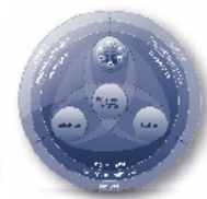
CPC® eingebettet in das General Management Modell

Subsysteme des Malik Management Systems, aus: