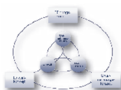
Unternehmenspolitik und Corporate Governance