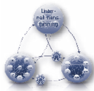
CPC® und Umweltmodell in In-Out-In-Logik