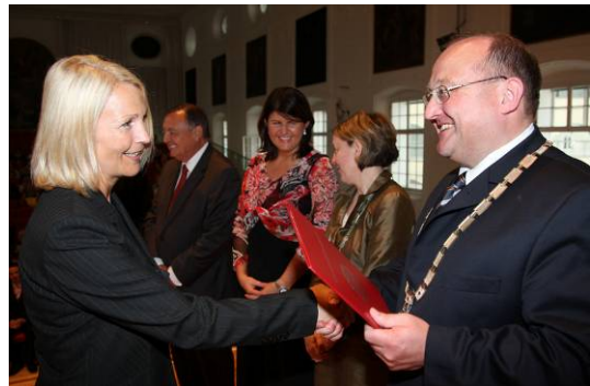
Feierliche Sponsion zum MBA an der Universität Salzburg

Im Rahmen des Universitätslehrganges ist eine Master's Thesis zu verfassen. Diese hat einen anwendungsorientierten und einen theoretischen Teil zu enthalten. Sie soll einen Umfang von 80 Seiten nicht unterschreiten und schwerpunktmäßig einen Themenbereich aus dem zweiten Abschnitt vertiefend behandeln. Dabei sind erworbenes Wissen und Kompetenzen auf konkrete unternehmerische Frage- und Problemstellungen anzuwenden.