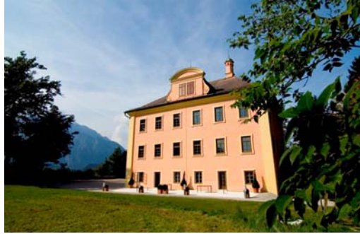
Schloss Urstein: Management "State of the Art" in traditionsreichem Ambiente

Dem gesamtwirtschaftlichen Umfeld einer Unternehmung wird mit Themen wie z.B. Markt und Wettbewerb, Gesetzgebung und Politik entsprechend Rechnung getragen. Und neben Ethik mit Fokus auf Corporate Governance nimmt die betriebliche Entscheidungsfindung einen besonderen Stellenwert ein.