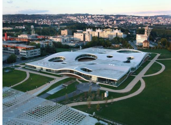
Ecole Polytechnique Fédérale de Lausanne

Modul 7 führt uns nach Lausanne/Genf (CH) und Brüssel (B) und behandelt "Policy Entrepreneurship in Public Health". Abgerundet wird dieses Modul durch Workshops und Diskussionen mit ExpertInnen in den EU-Institutionen und -Organisationen. Dieses Modul findet auf Englisch statt.