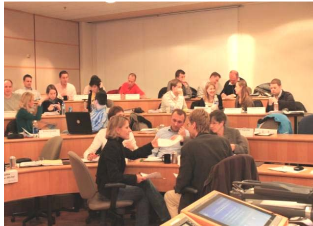
Gruppenarbeit im Modul

Auch Modul 6 findet in Kooperation mit dem HCM e.V. Health Care Management (Institut an der Philipps Universität Marburg), dem Centrum für Krankenhaus-Management (Institut an der Universität Münster) und dem Zentrum für Forschungscoordination und Bildung GmbH (zfb GmbH Offenbach) statt. In diesem Modul "Instrumente des Health Care Managements" werden neben Gesundheitsökonomie die Themen Informationsmanagement im Gesundheitswesen sowie Logistik und Qualitätsmanagement anhand von praktischen Beispielen in Gesundheitseinrichtungen vermittelt. Ein weiterer Themenkomplex ist der Vergleich europäischer Gesundheitssysteme.