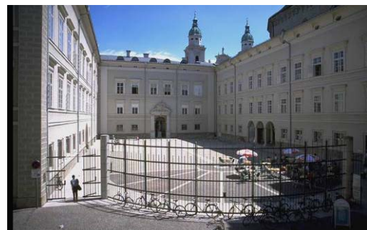
Rechtswissenschaftliche Fakultät der Universität Salzburg

Die Universität Salzburg ist Rechtsträgerin des Universitätslehrgangs "International Executive MBA". Inhaltlich wird der Lehrgang vor allem von Angehörigen der Rechtswissenschaftlichen Fakultät betreut. Die Fakultät mit ihren fast 4000 Studierenden bietet im Regelstudium ein Diplomstudium Rechtswissenschaften, ein Doktoratsstudium Rechtswissenschaften, ein Bachelor- und ein Masterstudium Recht und Wirtschaft sowie ein Doktoratsstudium Wirtschaftswissenschaften an. In allen nationalen und internationalen Rankings der letzten Jahre hat die Salzburger Fakultät stets den österreichischen Spitzenplatz eingenommen und sich auch im europäischen Vergleich der Rechtsfakultäten ausgezeichnet positioniert. Die Fakultät ist zusammen mit ihrer gut ausgestatteten Bibliothek im beeindruckenden Ambiente des Toskana-Trakts der Salzburger Residenz untergebracht.