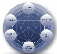
Der Komplex des Central Performance Control®