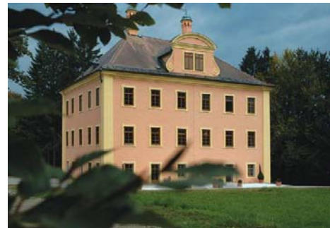
Schloss Urstein, Puch bei Salzburg

Die Akademie Urstein ist eine Privatstiftung der Wirtschaftskammer Salzburg und 2002 mit dem Zweck der Erwachsenenbildung auf Hochschulniveau und der Durchführung von Forschungsprojekten gegründet worden. Die Akademie Urstein versteht sich als Ort der Begegnung für Management-Interessierte aus den verschiedensten Fachbereichen.