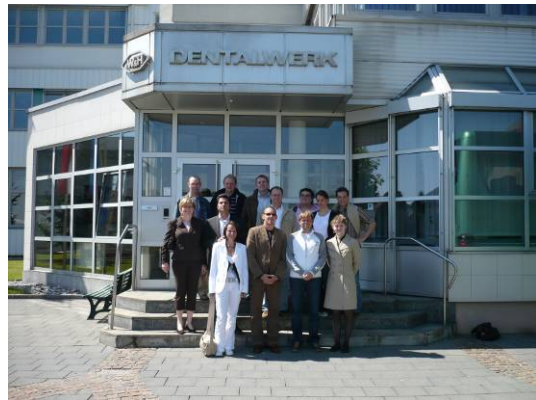
Rahmenprogramme runden das inhaltliche Angebot ab:

Modul 3 widmet sich der Unternehmenskultur und den Führungskräften. Im Mittelpunkt stehen Social Competences und Human Resources, wobei Themen wie Mitarbeiterorientierung, Personalmanagement und -entwicklung, Anreiz- und Motivationssystemen Rechnung getragen wird. Im Rahmen des Marketings werden insbesondere die für eine Markt- und Kundenorientierung notwendigen Aspekte der Unternehmensführung herausgearbeitet. Customer Relationship Management wird ebenso thematisiert wie Marketingphilosophie, -planung und -mix