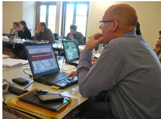
Studierende des MBA 2008 auf Schloss Urstein

Mit Modul 2 wird der Systematik und Methodik in der Unternehmensführung besonderer Stellenwert eingeräumt. Inhalte wie Projektmanagement (Projektplanung, -organisation, -umsetzung und -kontrolle), Prozessmanagement (Kernprozesse, Prozessoptimierung, Instrumente und Techniken) und Wertschöpfungsmanagement (Operations, Supply Chain Management) werden explizit abgehandelt. Auch Methoden und Systematiken der Organisationsentwicklung werden praxisorientiert vermittelt.