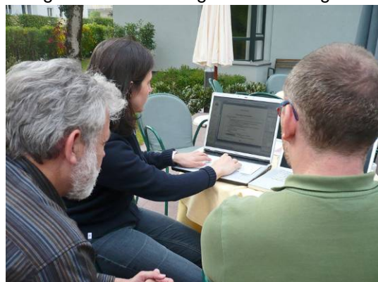
Konzentrierte Arbeit am Business Case

Modul 4 vertieft betriebswirtschaftliches Fachwissen zu finanziellen Aspekten der Unternehmensführung und praktische Aspekte der Entscheidungsfindung. Zunächst werden die Gesamtzusammenhänge zwischen den einzelnen Teilbereichen des betrieblichen Rechnungswesens erläutert. Ausgehend von der Verpflichtung zur Erstellung des externen Rechnungswesens (Steuerbilanz, Jahresabschluss nach UGB bzw. IAS/IFRS) werden die Fertigkeiten zur Interpretation des Datenmaterials im Rahmen der Bilanzanalyse vermittelt sowie deren Steuerungswirkung für Entscheidungen der strategischen Unternehmensführung in Fallbeispielen hergeleitet. Darauf aufbauend werden die dem internen Rechnungswesen zugerechneten Entscheidungsebenen der Investition (Aktivseite der Bilanz) sowie der Finanzierung (Passivseite der Bilanz) sowohl theoretisch als auch anwendungsorientiert aufbereitet. Abschließend wird der Business Plan präsentiert, und die Zusammenhänge zwischen den Kernfächern des ersten Jahres im Fach Management Tasks and Management of Complex Systems aufgezeigt und diskutiert.