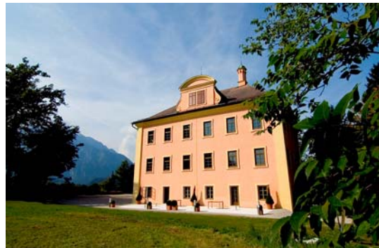
Modernes Management im traditionsreichem Ambiente: Die SMBS auf Schloss Urstein

Management-Inhalte "State of the Art" von Top-Vortragenden vermittelt für direkte Anwendung und Umsetzung. Die SMBS setzt auf geblockte Präsenzmodule, um den Lerngewinn für Führungskräfte effizient zu gestalten. Austausch, Diskussion und Case Studies führen zu einem praxisorientierten und tiefen Verständnis der vermittelten Management-Inhalte: Denn in der Anwendung werden Details der Theorie vertieft und durch Feedback verbessert. Zudem zeigte sich im Laufe der Jahre dieser Modus der Durchführung als ideal für Berufstätige.